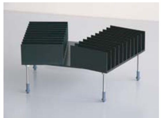
ミラー保温専用スタンドCタイプHS-12C6G3